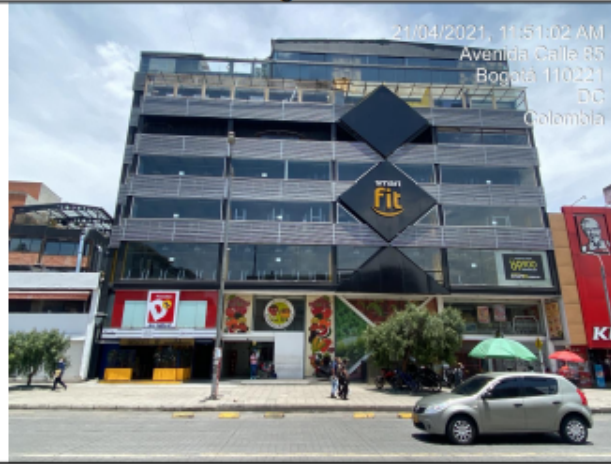
Fachada del establecimiento